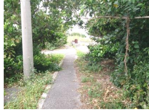
③農協出荷場への遊歩道