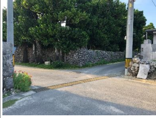
②名石集落の交差点