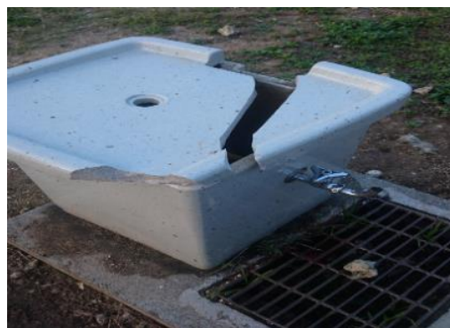
⑫集落センターの水飲み場