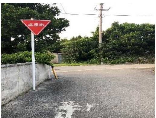
⑧前集落 T 字路