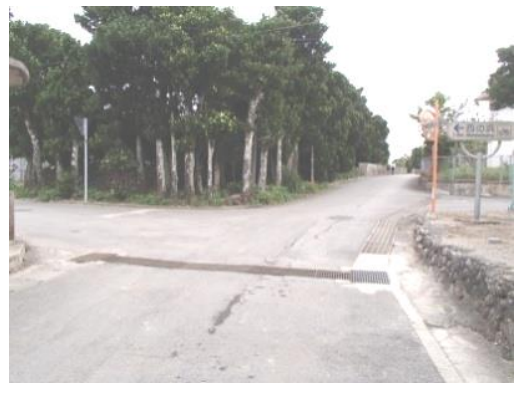
①名石売店と学校西側の交差点