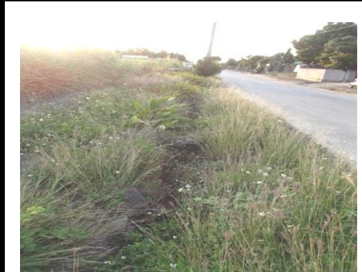
⑤富嘉集落への道路の側溝