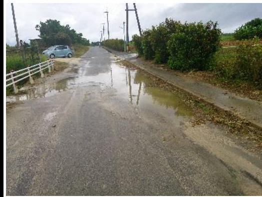
④発電所から出る交差点