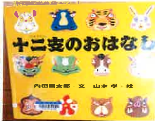
『十二支のおはなし』