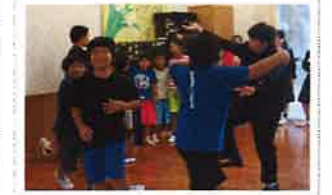
実演『カチャーシー大会』