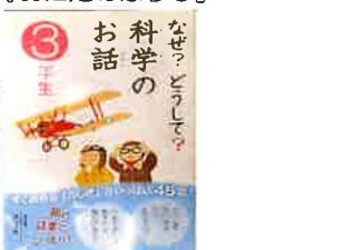
『なぜ? どうして? 科学のお話』