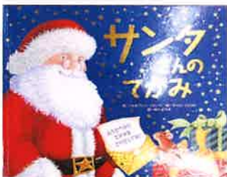
『サンタさんのてがみ』