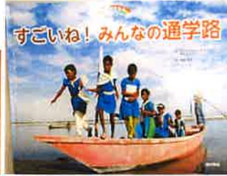
『すごいね! みんなの通学路』