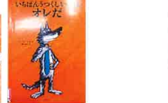
『いちばんうつくしいのはオレだ』

お忙しい中、読み聞かせをしていただき、ありがとうございます。これからも地域に開かれた学校づくりを推進していきますので、ご協力をよろしくお願いいたします。