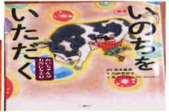
『いのちをいただく』